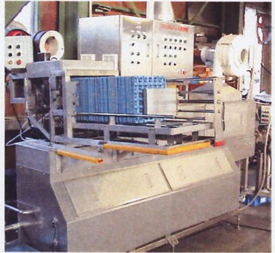
洗浄機TW2004と乾燥機TD2004を直角配置した写真