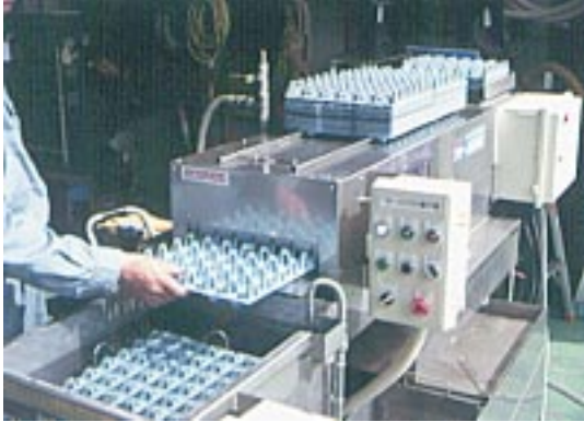
▲自動整列・手前搬送(標準装備)