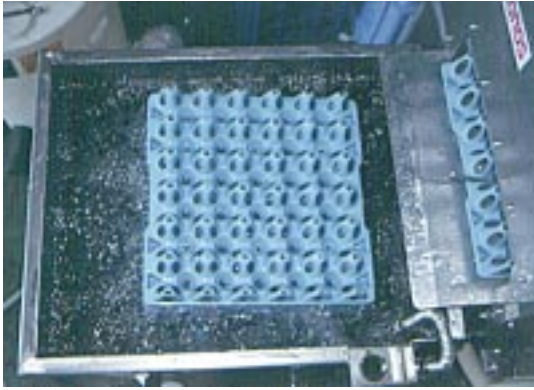
▲バブリングタンク(オプション)